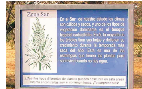
Imagen 2. Mapa y letreros de sección actuales en el JBUAP.