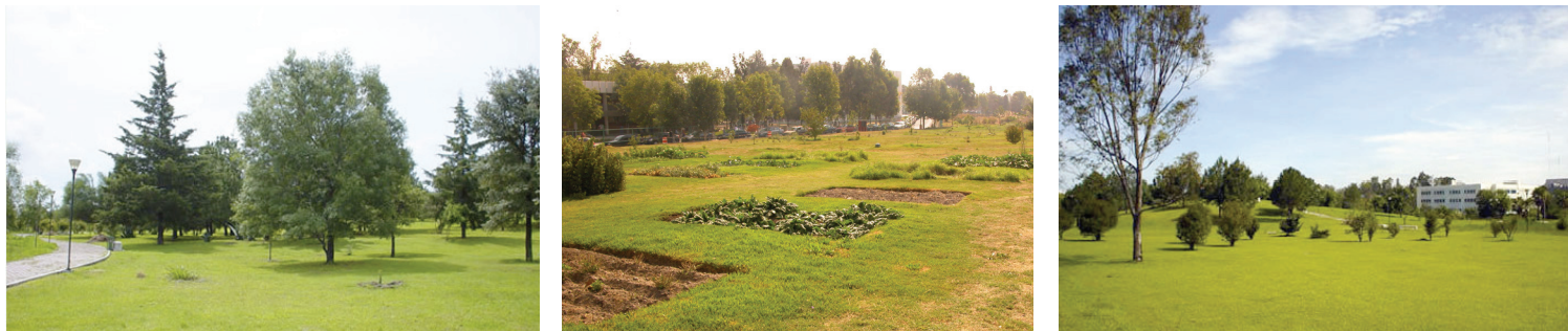
Imagen 1. Espacios del JBBUAP.