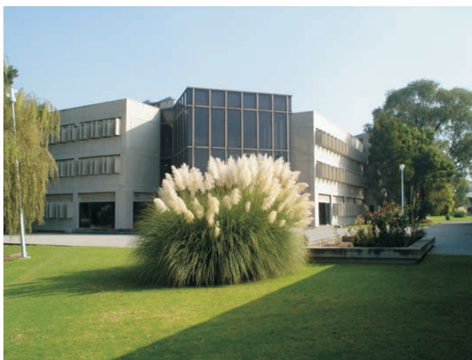
Figura 3. Vista general del edificio de aulas del Colegio de Postgraduados, Campus Montecillo, en Texcoco, Estado de México.

Sus estudiantes, profesores, ex alumnos y personal de apoyo buscan esos objetivos en un contexto de libertad con responsabilidad. Impulsa la iniciativa, la integridad y la excelencia académica en un ambiente de humanismo, honradez, trabajo creativo y civilidad y sus hallazgos como Centro Público de Investigación están al servicio de la sociedad.