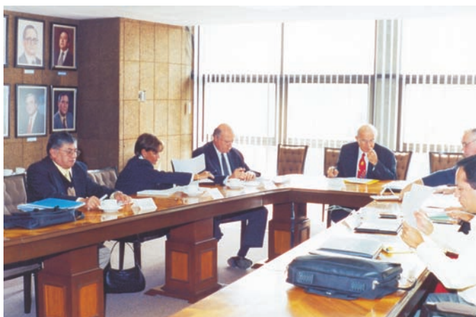
Figura 2. Taller de Visión en la sala de Consejo del Colegio de Postgraduados, Campus Montecillo, en Texcoco, Estado de México.

Al finalizar dos sesiones de una hora y media cada una se obtuvieron importantes datos acerca de los objetivos, las necesidades, las audiencias de interés y los argumentos que se utilizarán en los mensajes comunicativos. Por añadidura se identifican también las fortalezas, debilidades y áreas de oportunidad en el rubro de la comunicación hacia el exterior a través del sitio web, cuyo conocimiento ayudará al CP a construir de manera estratégica un sitio web que responda a las necesidades y objetivos de la audiencia meta sin descuidar las necesidades y objetivos institucionales.