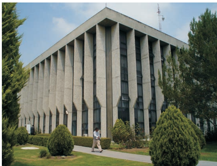
Figura 1. Vista general del edificio de gobierno del Colegio de Postgraduados, Campus Montecillo, en Texcoco, Estado de México.

En 2001 y para efectos de la Ley para el Fomento de la Investigación Científica y Tecnológica, la Secretaría de Agricultura, Ganadería, Desarrollo Rural, Pesca y Alimentación y el Consejo Nacional de Ciencia y Tecnología, se reconoce al Colegio de Postgraduados como Centro Público de investigación (Diario Oficial del 8 de agosto de 2001).