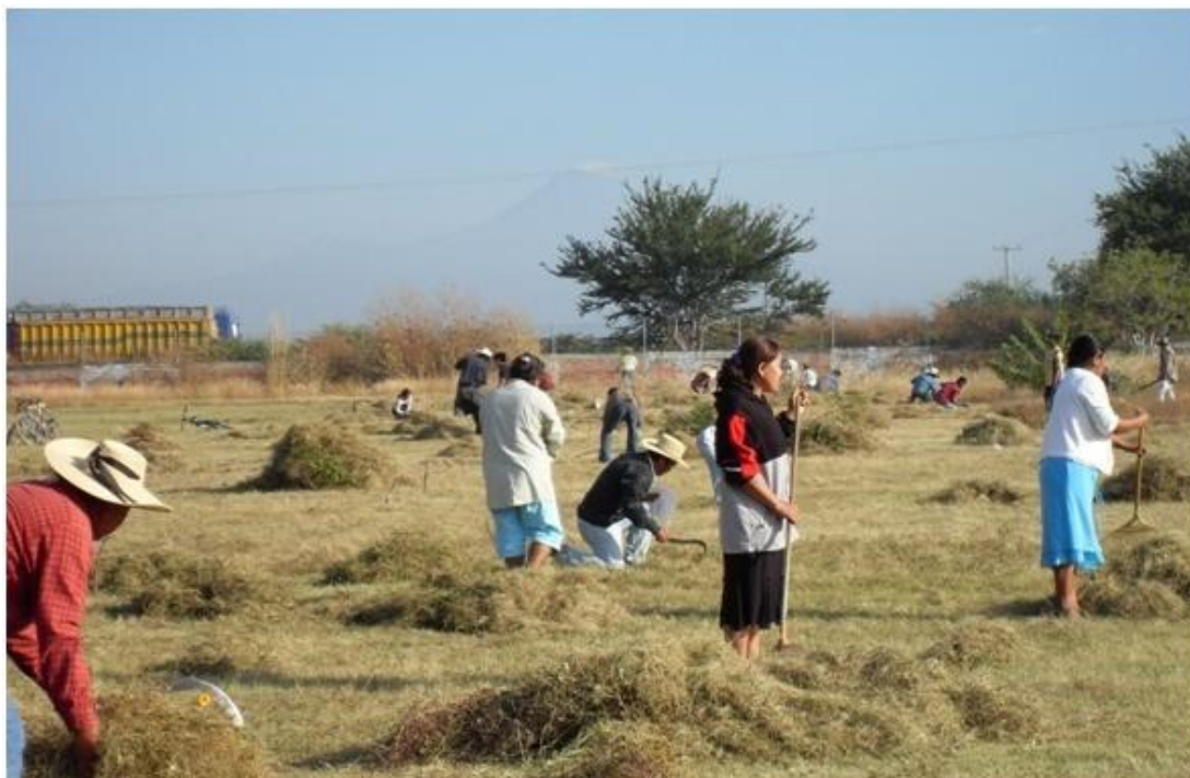
Tequio en la TSE Lázaro Cárdenas de Teotlalco

La TSE Lázaro Cárdenas del Río se ubica en la localidad de Teotlalco. Para llegar a la comunidad de Teotlalco es necesario llegar a Axochiapan Morelos y de ahí adentrarnos nuevamente al estado de Puebla. A continuación se presenta una breve descripción de la percepción de profesor y alumnos de su comunidad.